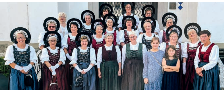
Der Trachtensontag feierte der Verein am 1. Oktober 2023 in der Pfarrkirche in Eschen. Der Gottesdienst begann mit einem feierlichen Einzug. Musikalisch wurde der Gottesdienst vom Nofler Dreigesang umrahmt.