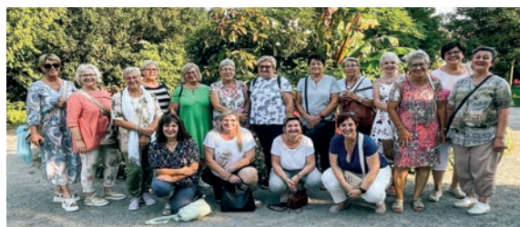
Im September 2023 genossen die Trachtenfrauen den alljährlichen Ausflug. Dieses Jahr reisten sie über den Bodensee ins wunderschöne Städtchen Meersburg. Den Tag liessen sie in Bregenz ausklingen.