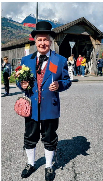
Die Feierlichkeiten zum 100-jährigen Jubiläum des Zollvertrages Schweiz-Liechtenstein waren ein Höhepunkt des Jahres 2023 der Liechtensteinischen Trachtenvereinigung