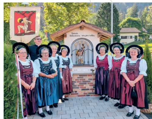
Ein besonderer Anlass war die Einweihung des Bildstöckle in Nendeln. Der Verein folgte im August 2023 der Einladung der St. Sebastian-Bruderschaft.