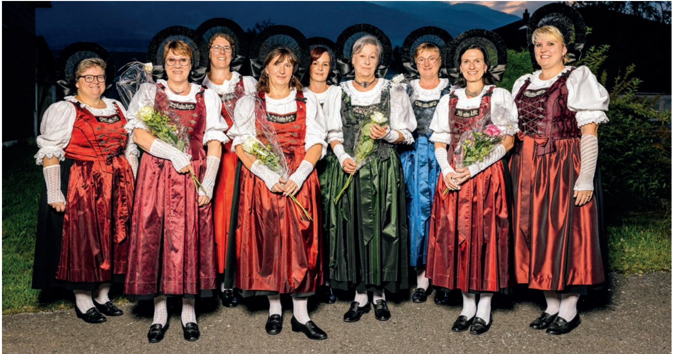
Acht Trachtenträgerinnen wurden von Seiten des Vorstandes für ihren Einsatz für das liechtensteinische Trachtenwesen mit der goldenen oder silbernen Ehrennadel oder mit einer Ehrenurkunde geehrt.

Am 7. September 2023 trafen sich die Jubilarinnen und Jubilare zusammen mit ihren Präsidentinnen und Präsidenten und dem Vorstand der Liechtensteinischen Trachtenvereinigung im Restaurant Schäfle in Triesen zu einer Feierstunde. Der Abend stand ganz im Zeichen der Schönheit Liechtensteiner Tracht und im Zeichen der Ehrungen für langjährige aktive Vereinsmitglieder bzw. der verdienten Jubilarinnen und Jubilare der Trachtenvereine und -gruppen sowie der angeschlossenen Vereine. Es konnten acht Trachtenfrauen für ihren Einsatz in den Trachtenvereinen mit der silbernen oder goldenen Ehrennadel geehrt werden.