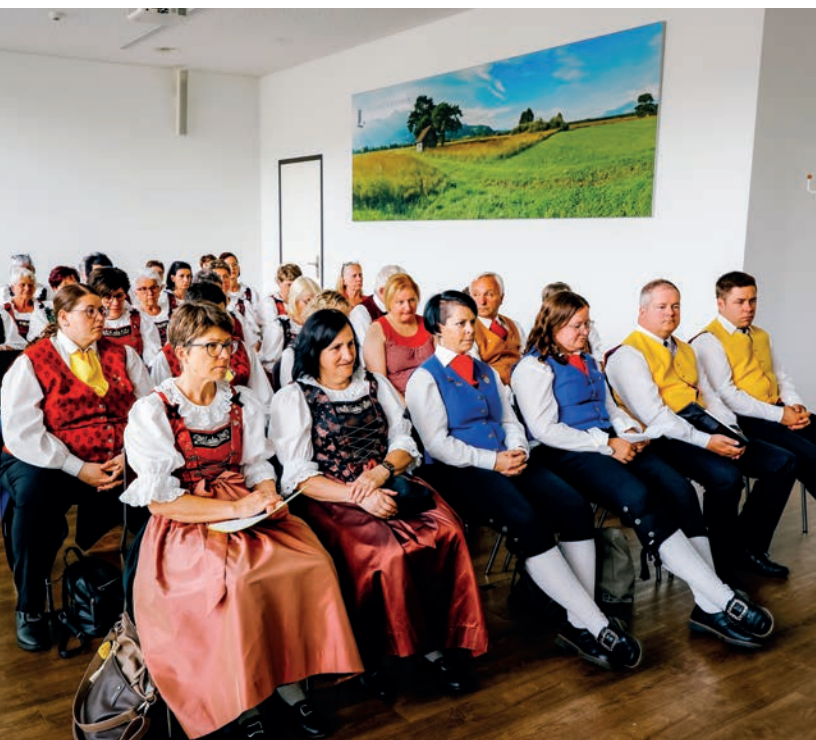
Die Teilnehmerinnen und Teilnehmer anlässlich der 57. Delegiertenversammlung der Liechtensteinischen Trachtenvereinigung.