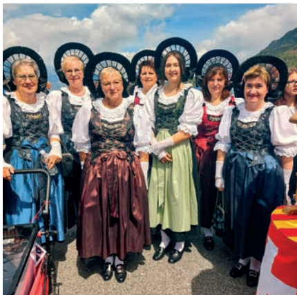
An den Feierlichkeiten in Vaduz anlässlich des Jubiläums zum 100-jährigen Bestehen des Zollvertrags Schweiz - Liechtenstein nahmen einige Trachtenträgerinnen des Vereins teil.